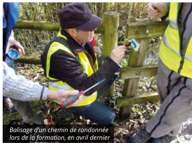
Balisage d'un chemin de randonnée lors de la formation, en avril dernier

Après avoir reçu une formation de deux jours par le Comité Départemental de la Randonnée Pédestre, en avril dernier, les baliseurs, armés d'adhésifs et de peinture, arpentent depuis plusieurs mois les différents circuits.