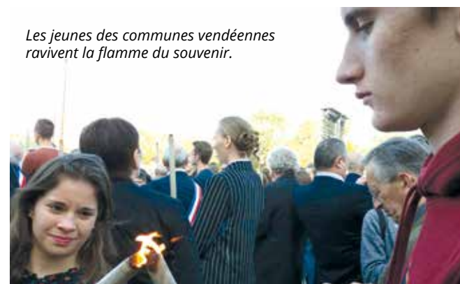
Les jeunes des communes vendéennes ravivent la flamme du souvenir.

Isabelle Bourasseau • Correspondant défense 06 29 97 93 44 • i.bourasseau@ccfulgent-essarts.fr